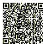
スマートフォン用QRコード